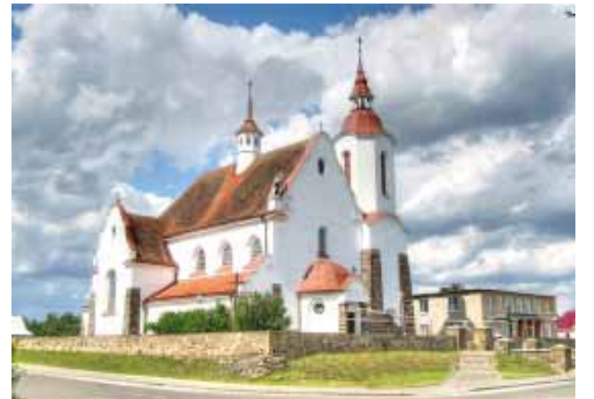
Касцёл Маці Божай Ружанцовай у в. Соля

будуюцца пад уплывам эклектыкі і мадэрну. У 30-я гг. XX ст. у архітэктуры Польшчы ўзнікаюць моцныя ўплывы канструктывізму і функцыяналізму. Адначасова адбываецца рэанімацыя “неастыліяў”, асабліва неаготычнага і неакласічнага кірункаў.