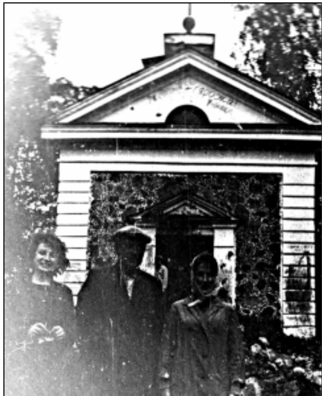
Манькавіцкая капліца, 1965 г.

ладзілася свята "Божэ цяло", на якое з'язджаліся ксяндзы і католікі з наваколля. На фест збіралася шмат народу, ладзілася сцэна, працаваў гандаль. Але гэта ўсё ў мінулым. Зараз жа капліца знаходзіцца ў вельмі занябаным стане: склеп з пахаваннямі разбураны, тынкоўка ў многіх месцах абвалілася, ледзь трымаецца дах.