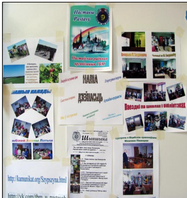
Стэнд Пастаўскай раённай арганізацыі Таварыства беларускай мовы імя Ф. Скарыны

На парадку дня кангрэса былі: справядача аб стане грамадзянскай супольнасці ў краіне, развіцці рэгіянальных ініцыятываў, прэзентацыя прэміі “Чэмпіёны грамадзянскай супольнасці”, а таксама восем тэматычных круглых сталоў. Сябрамі Асамблеі на дадзены момант з’яўляюцца 302 беларускія няўрадавыя арганізацыі, большасць з якіх і накіравалі сваіх прадстаўнікоў на форум. У працы кангрэсу бралі ўдзел і сябры пастаўскай раённай арганізацыі ТБМ, якія прэзентавалі сваю дзейнасць праз інфармацыйны стэнд і апошнія нумары бюлетэня “Шыпшына”.