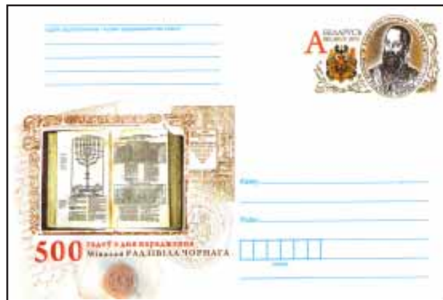
Канверт, выпушчаны "Белпоштай" да 500-годдзя з дня нараджэння М. Радзівіла Чорнага